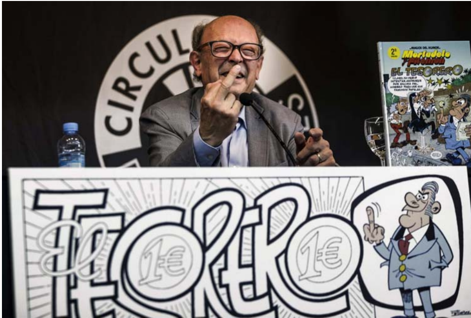
Francisco Ibáñez en la presentación de su nuevo cómic

El dibujante Francisco Ibáñez presenta el álbum número 200 de sus personajes más populares: una sátira sobre las erráticas finanzas de Bárcenas y el "Partido Papilar"